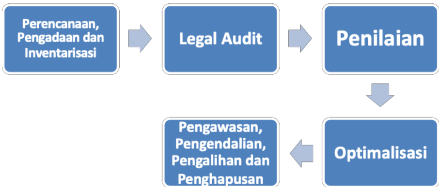
Gambar 3.1 Alur Proses dalam Manajemen Sarana dan Prasarana

Organisasi manajemen prasarana dan sarana tidak terlepas dari proses-proses yang berlangsung di dalamnya sebagai sebuah sistem. Salah satu bagian penting dalam manajemen prasarana dan sarana perguruan tinggi adalah manajemen prasarana dan sarana pendidikan. Keberadaan prasarana dan sarana tersebut sangat menentukan keberhasilan proses pendidikan. Setiap pengelolaan sarana prasarana perlu menempuh alur tahap demi tahap yang sistematis dan menyeluruh. Tahap-tahap dalam alur dalam manajemen sarana dan prasarana dapat digambarkan sebagai berikut.