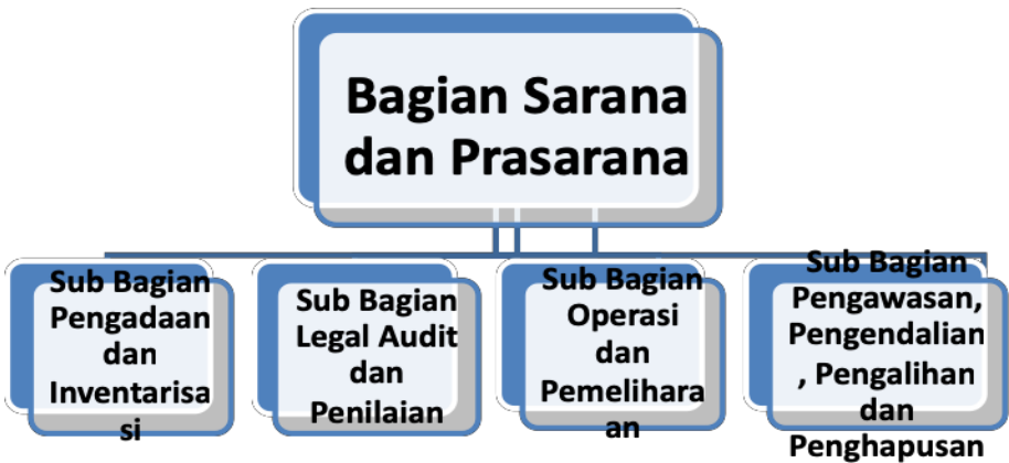
Gambar 3.2 Organisasi Pelaksana Pengelola Sarana Prasarana

Berdasarkan alur proses dalam manajemen pengelolaan sarana prasarana, maka secara umum organisasi pelaksana sarana prasarana dapat dikategorikan menjadi dua bagian penting. Kategori atau bagian yang pertama adalah bagian pengadaan, audit, dan penilaian. Kemudian bagian yang kedua adalah bagian operasi, pemeliharaan, pengendalian, pemeliharaan dan penghapusan. Kedua kategori atau bagian tersebut, dapat digunakan sebagai dasar dalam menyusun organisasi pelaksana dalam manajemen sarana prasarana pendidikan yang ada. Adapun struktur atau organisasi pelaksana pengelola sarana prasarana pendidikan adalah seperti pada gambar berikut.