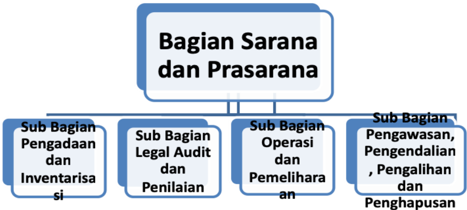
Gambar 3.2 Organisasi Pelaksana Pengelola Sarana Prasarana

Berdasarkan alur proses dalam manajemen pengelolaan sarana prasarana, maka secara umum organisasi pelaksana sarana prasarana dapat dikategorikan menjadi dua bagian penting. Kategori atau bagian yang pertama adalah bagian pengadaan, audit, dan penilaian. Kemudian bagian yang kedua adalah bagian operasi, pemeliharaan, pengendalian, pemeliharaan dan penghapusan. Kedua kategori atau bagian tersebut, dapat digunakan sebagai dasar dalam menyusun organisasi pelaksana dalam manajemen sarana prasarana pendidikan yang ada. Adapun struktur atau organisasi pelaksana pengelola sarana prasarana pendidikan adalah seperti pada gambar berikut.