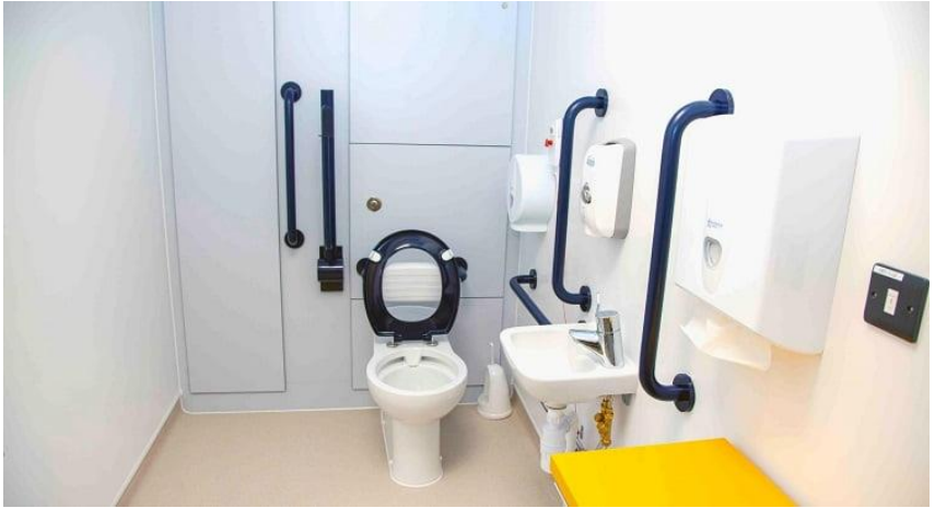
Wastafel Disabilitas