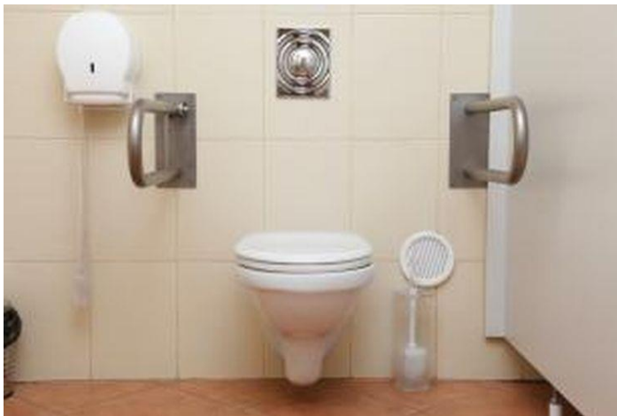
Toilet Disabilitas