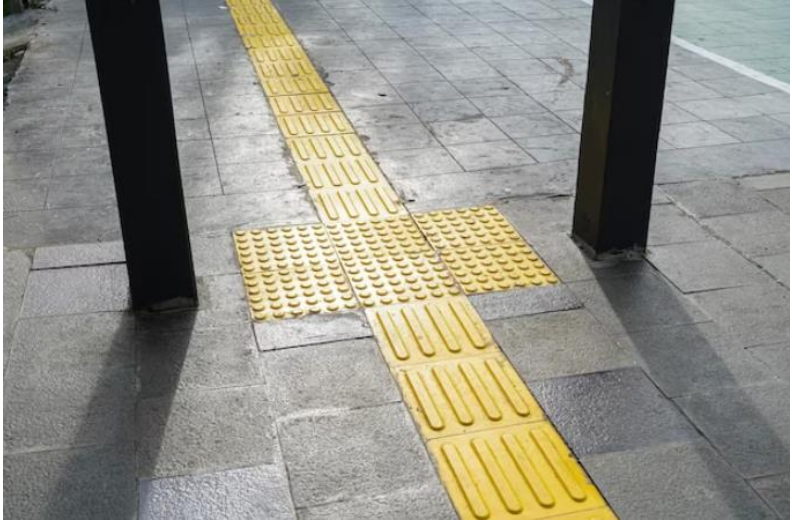
Guiding Block